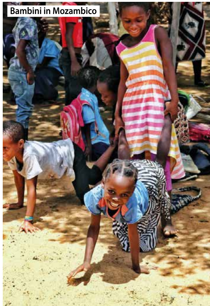
Bambini in Mozambico