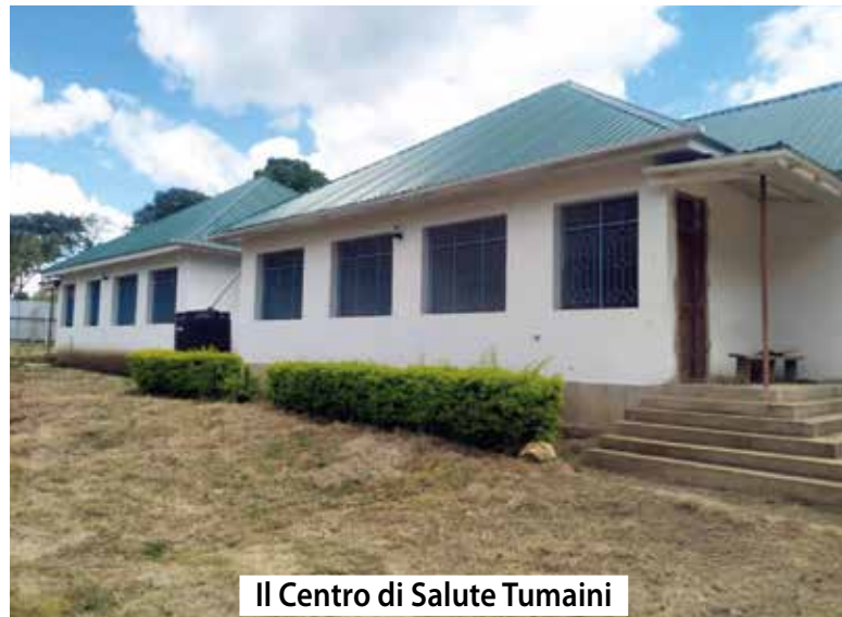
Il Centro di Salute Tumaini

Il centro oggi dipende dalle piccole entrate che i pazienti possono offrire.