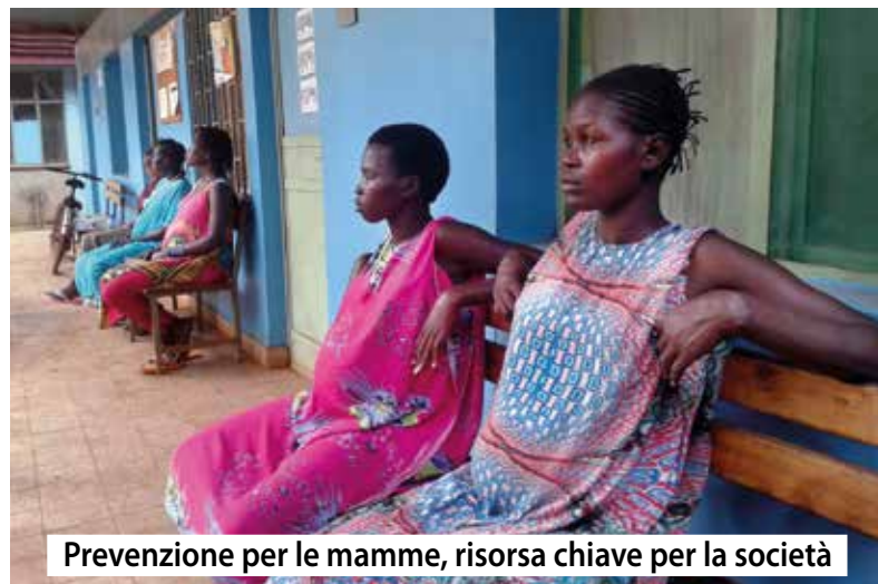
Prevenzione per le mamme, risorsa chiave per la società

«Seguiamo le madri durante la gravidanza, nel periodo post natale e per le vaccinazioni del bambino. Facciamo anche educazione sanitaria su alimentazione, igiene e patologie più diffuse come anemia, parassiti, malaria, Hiv».