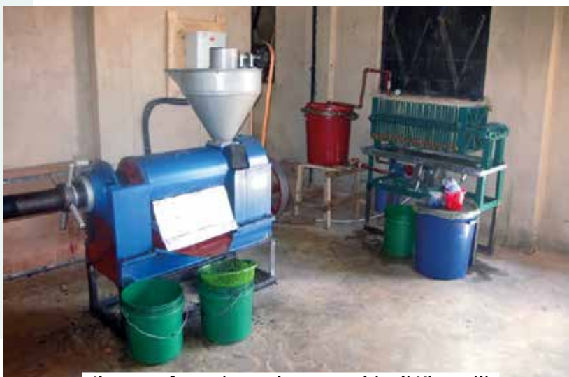
Il nuovo frantoio per la parrocchia di Kitangili