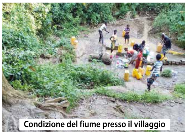
Condizione del fiume presso il villaggio

che serva le scuole e tutta la popolazione dell'area, contenendo in questo modo la diffusione di malattie trasmesse dall'inquinamento della fonte pubblica.