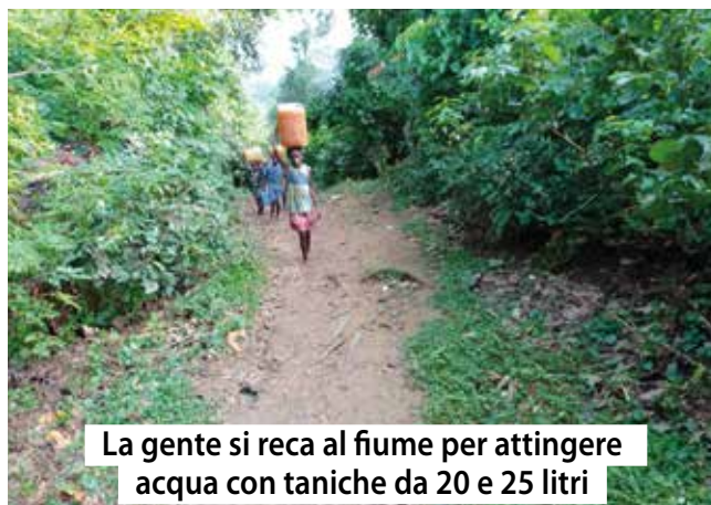
La gente si reca al fiume per attingere acqua con taniche da 20 e 25 litri

Le Suore Serve di Maria di Boma che hanno a Nsumbi una scuola primaria e una professionale, desiderano realizzare un pozzo