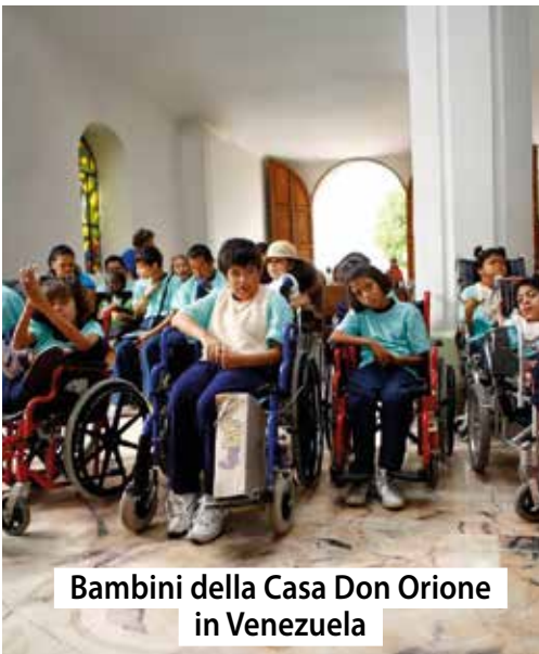
Bambini della Casa Don Orione in Venezuela