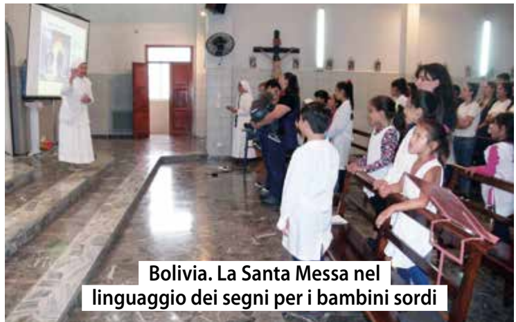
Bolivia. La Santa Messa nel linguaggio dei segni per i bambini sordi

Le Suore della Compagnia di Maria offrono ai bambini sordomuti la possibilità di frequentare la scuola. Gli aiuti ricevuti consentono a questi piccoli, in condizioni di vulnerabilità ed emarginazione, di frequentarla fruendo di un'assistenza specializzata.