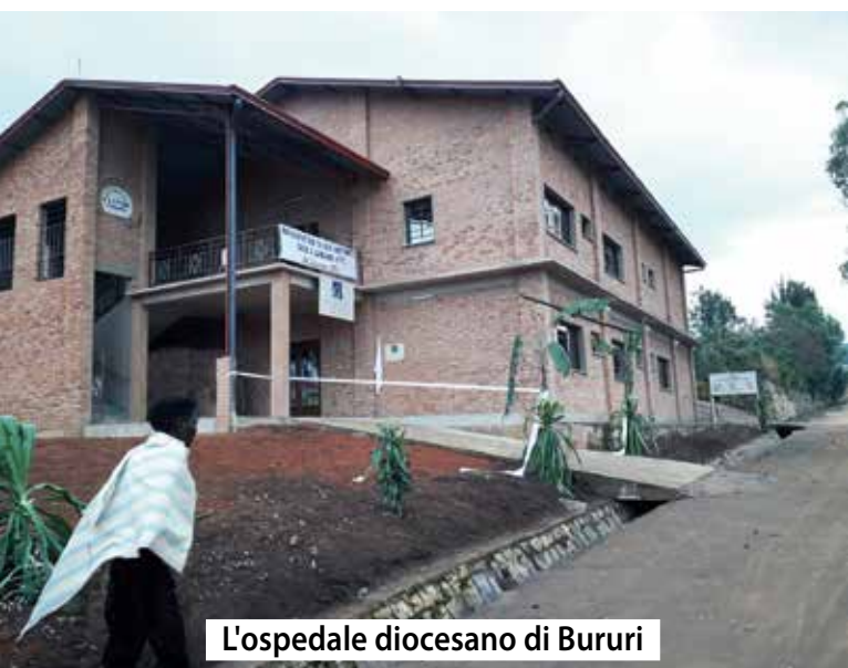
L'ospedale diocesano di Bururi

L'estrema povertà, che causa la malnutrizione, le malattie (soprattutto malaria e Aids) e la mancata assistenza a gravidanza e parto, è tra le principali cause di un'altissima mortalità.